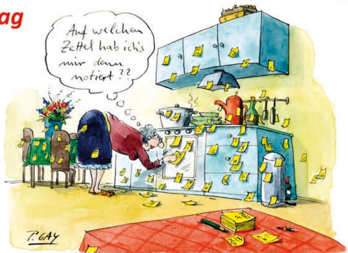
Die Veranstaltung wird gefördert durch die AOK PLUS Sachsen.

Es besteht die Möglichkeit zum Erfahrungsaustausch mit Angehörigen.