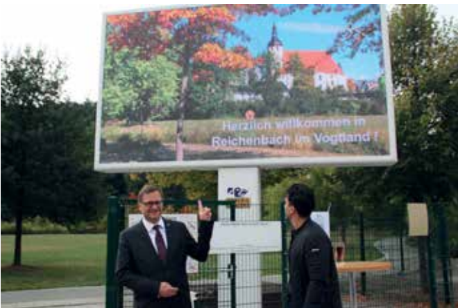
Die Zwickauer Firma Comedia Concept hat eine zwölf Quadratmeter große LED-Werbetafel, direkt an der Bundesstraße 94, errichtet. Zu sehen ist der Monitor aus Richtung Am Graben und Reichsstraße. Durch diesen Großbildschirm im öffentlichen Raum gibt es eine neue Möglichkeit der digitalen Werbung. Vom Wetter über einen breiten Branchenmix bis hin zur aktuellen Veranstaltung informieren die wechselnden Bilder.