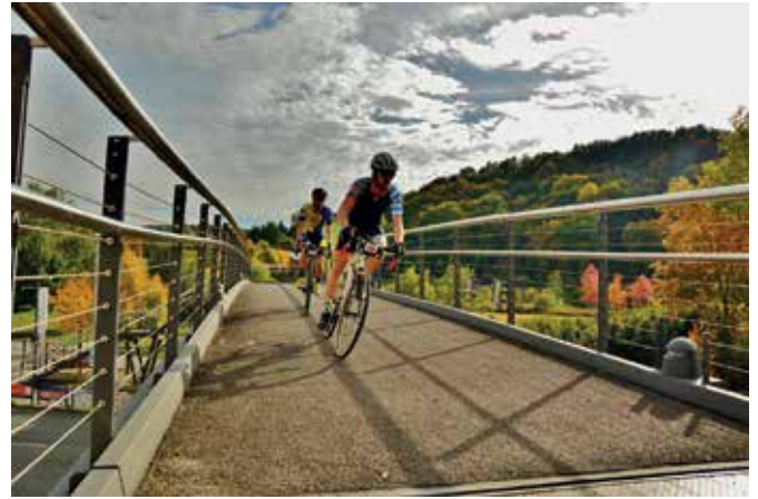
Fotos oben: Cyclo-Bike am 05., 06. Oktober im Park der Generationen. Die Rundstrecke hatte es in sich. Durchquert werden musste beispielsweise ein offener LKW. Das Rad war über Sandgruben und Baumstämme zu tragen. Auf der Rundstrecke lieferten sich neben den sächsischen Radsportlern auch Aktive aus Bayern, Berlin und Thüringen spannende Rennen.