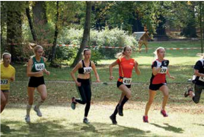
Foto links: Am Herbstcross im Stadtpark, gleichzeitig Regional- und Vogtlandmeisterschaft, nahmen 250 Sportler teil. Zwei, vier oder sechs Kilometer waren die Strecken lang. Organisiert hatte den Wettkampf der LAV Reichenbach.