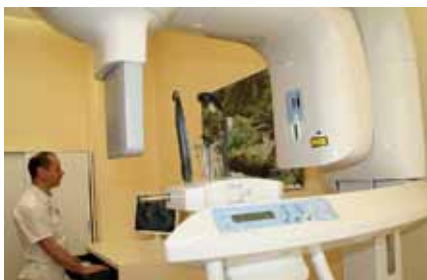
Das moderne, strahlenreduzierte Röntgengerät ermöglicht 3 D-Rundumröntgen und die Gesamtaufnahme von Gebiss und Kiefer.