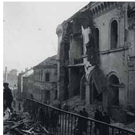
21. März 1945, gegen 10:00 Uhr, Bombenangriff auf Reichenbach - Am Graben mit Blick auf das zerstörte Rathaus.

Am 17. April jährt sich zum 70. mal die kampflose Übergabe der Stadt Reichenbach an die Amerikanischen Truppen.