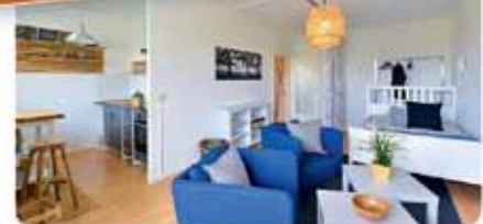
Wohnbeispiel einer möblierten 1-Raum-Wohnung

Energie: V / 95,0 kWh/(m 2 *a) inkl. Warmwasser - Energieträger Fernwärme - Baujahr 1981