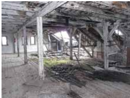
Fotos: Außenansicht vom Gebäude und Innenansicht.