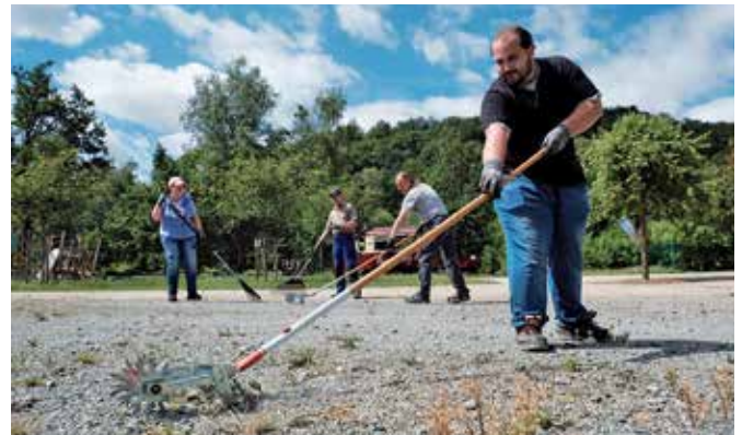
Entfernen von Gras durch Rollhacken auf dem Festplatz im Park der Generationen.

Als günstigste Alternative ist der Einsatz eines Gasbrenners um 73 Cent pro Quadratmeter teurer als Glyphosat, was insgesamt in Reichenbach Mehrkosten von 34.310 Euro bedeuten würde. Andere Alternativen, wie Heißwasser oder das Herbizid Finalsan, wären noch teurer. Eine händische Beseitigung, beispielsweise durch Rollhacken, bedarf immer eines hohen Personaleinsatzes.