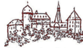
Museum Burg Mylau