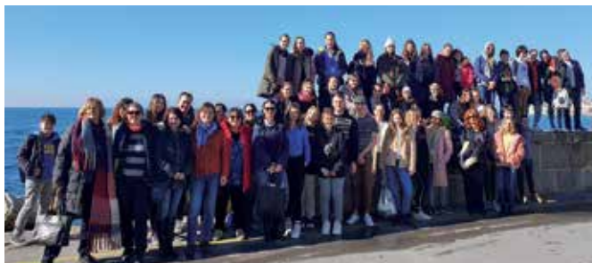
Die Teilnehmer am Erasmus+Projekt

Unser erster Austausch führte uns in den Winterferien nach Ljubljana, wo wir unsere Länder und Schulen vorgestellt haben, den Bürgermeister getroffen und Slowenien und seine Bewohner durch Schule und Gastfamilien kennen gelernt haben.