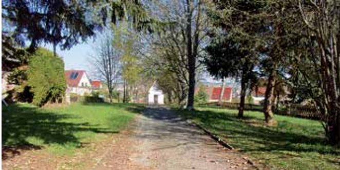
Der Zustand des Weges vor der Baumaßnahme.

Der Stadtrat hat in seiner Dezembersitzung Arbeiten für Instandsetzung des Weges zwischen Rotschauer Weg und An der Schönen Aussicht (Mittelweg) an die Firma Hoch- und Tiefbau GmbH Reichenbach vergeben. Die Arbeiten haben Ende Februar begonnen. Während der Bauzeit, die bis Ende Juni geplant ist, wird der Gehweg zwischen Rotschauer Weg und Klein Grönland, zwischen Klein Grönland und Göltzschtalblick sowie zwischen Göltzschtalblick und An der Schönen Aussicht für die Fußgänger voll gesperrt. In den Zufahrtsstraßen kommt es zu Behinderungen, wobei eine Durchfahrt aufrecht erhalten werden soll.