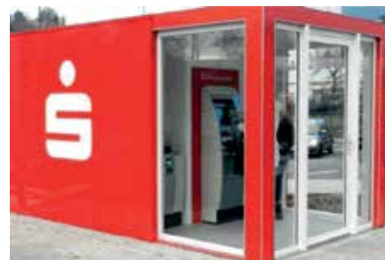
Abb.: beispielhafte Darstellung

Der neue Container soll laut Auskunft der Sparkasse spätestens am 10. November in Betrieb gehen. Er wird mit neuer Technik bestückt und im Gegensatz zum alten Container barrierefrei erreichbar sein.