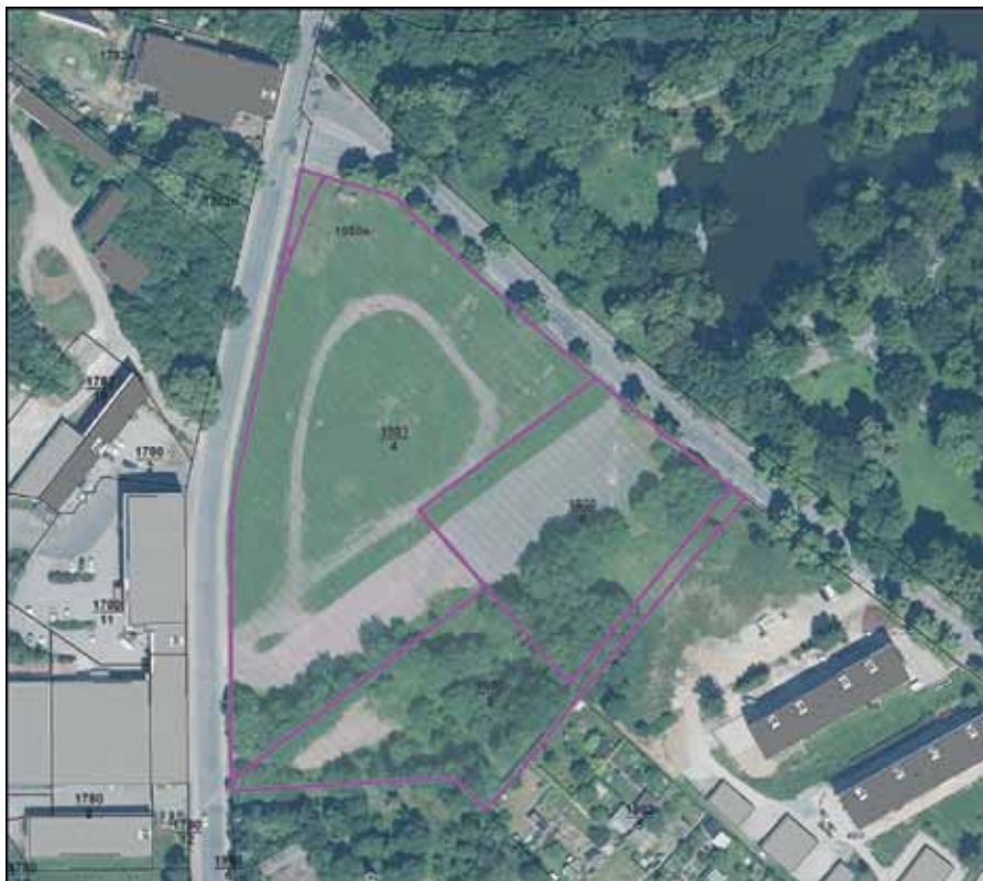
Lageplan Oberer Volksfestplatz Flurstücke-Nr.: 1803/4, 1803/5, 1803/6, 1958e