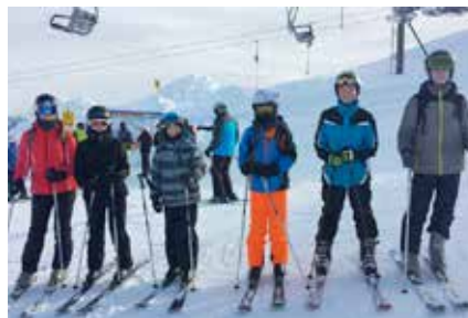
Auf dem Gipfel – jetzt kann es losgehen.

In der dritten Januarwoche führen alle Siebtklässler des Goethe-Gymnasiums ins Skilager. Die Schülerinnen und Schüler konnten zwischen der Alpin-Skiausbildung in den Alpen (Aschau im Chiemgau) oder der Langlauf- und Schwimmausbildung auf dem Rabenberg wählen. Die einen arbeiteten beim Langlauf an ihrem Diagonalschritt und am Doppelstockschub. Die Gruppe der alpinen Skifahrer begann entweder im Skigebiet Sachrang mit der Skiausbildung oder fuhr in Hochkössen (Österreich) die blauen, roten oder schwarzen Pisten herunter.