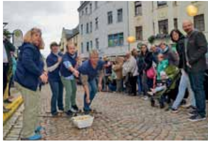
Tausende Besucher nahmen die kulinarischen Angebote und Attraktionen zum 3. Reichenbacher Kartoffelfest am 09. September gerne an. Zufrieden mit der Resonanz zeigte sich der Reichenbacher Gewerbeverein.