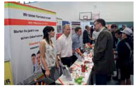
Beim 15. Berufsorientierungsmarkt am 13. September in der Sporthalle an der Cunsdorfer Straße haben sich 2.128 Besucher über die breite Palette an Ausbildungsberufen informiert. Das sind 171 mehr als im Vorjahr. Shuttlebusse brachten Schüler aus der ganzen Region nach Reichenbach. Einige kamen am Nachmittag mit den Eltern wieder, um intensivere Gespräche zu führen. Oft führt der Weg zum Ausbildungsplatz über Praktika und Ferienarbeit.

103 Anbieter, von A wie Assistent im medizin-technischen Bereich bis Z wie Zerspanungsmechaniker, waren vor Ort und präsentierten den Besuchern einen vielfältigen Branchenmix unter den Ausstellern. Die Veranstaltung wird gemeinsam von der SAQ mbH Zwickau, Niederlassung Reichenbach, und der Stadtverwaltung Reichenbach organisiert.