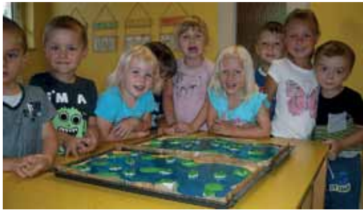
Text und Foto: Kindertagesstätte