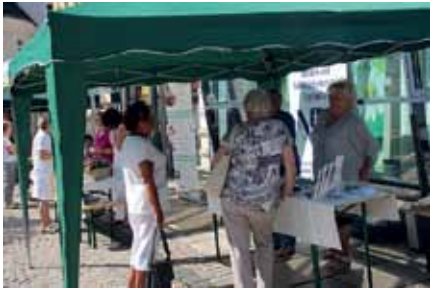
Zum Gesundheitstag am 30. August konnten sich die Besucher an den Ständen verschiedener Vereine, Institutionen und Firmen informieren, aktiv mitmachen oder Vorträge zu unterschiedlichen Themen erleben.