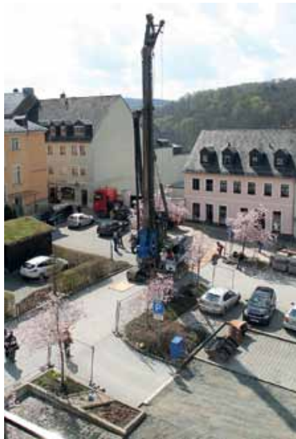
Abb. Architekturbüro Stadermann, Foto: K. Müller

Foto links: Die Anlieferung des fast 20 Meter hohen Krans für die Bohrungen mit einem Schwerlasttransport verursachte kleinere Staus im Stadtgebiet.