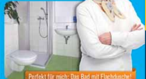
Perfekt für mich: Das Bad mit Flachdusche!

Kaution: 300,00 Euro • Energie: V / 110,40 kWh/(m 2 *a) inkl. Warmwasser - Fernwärme - Bj. 1982